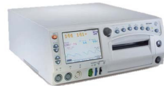
Moniteur maternel et fœtal Corometrics MC* de GE, série 250cx