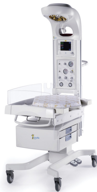
Table de réchauffement Giraffe MC* de GE avec panneau de réanimation et Nellcor MC SpO 2